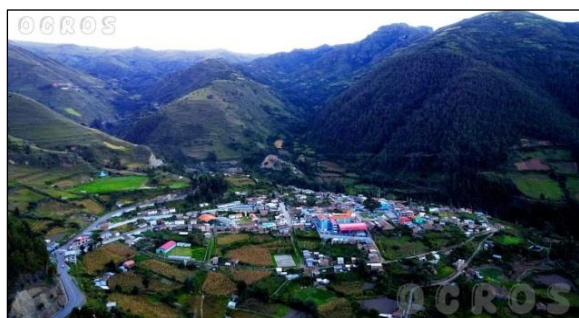
Figura 1. Distrito de Ocros, Ayacucho