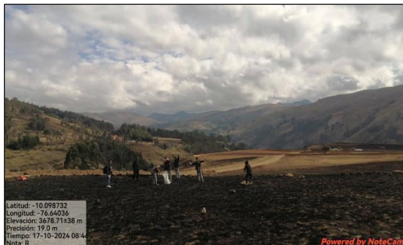
Figura 1. Muestreo de suelos en la parte quemada

Para determinar los cambios físicos, químicos y biológicos que impactan su capacidad productiva y ecológica, se empleó la siguiente metodología: